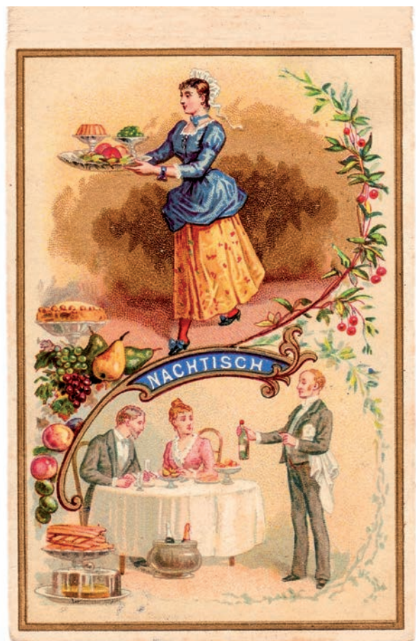
Kartengestaltung: ©TRAKTOR 41