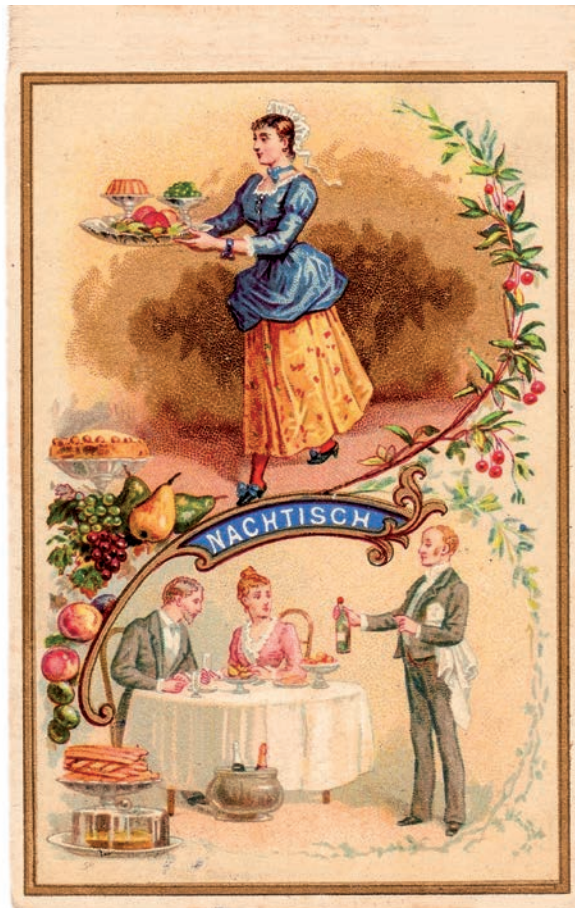
Kartengestaltung: ©TRAKTOR 41